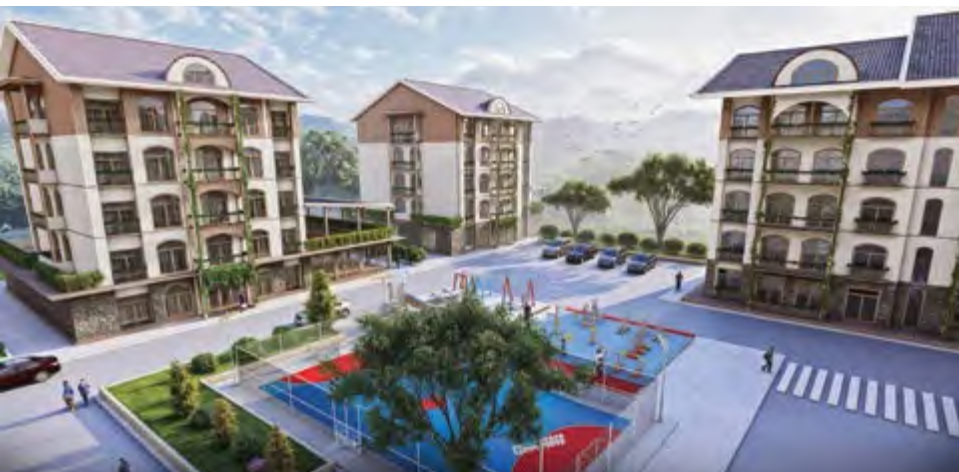
Концептуальное решение для жилых домов квартирного типа, предназначенное для студентов

– Среди наших ключевых проектов – активное участие в строительстве новых поселений в Карабахе. Мы занимались проектированием сел Гюллюджу и Салахлы, общей площадью около 480 га. Эти проекты включают строительство школ, детских садов, административных зданий, индивидуальных жилых домов и многоквартирных комплексов. Также мы принимали участие в разработке концепции Центрального парка в Агдаме, создавая комфортные зоны отдыха для жителей, и занимались проектированием и реконструкцией здания издательства, о котором уже упоминалось. Мы планируем расширяться не только в Азербайджане, но и за его пределами – в настоящее время ведутся работы по реконструкции и строительству объектов в Узбекистане и Казахстане, а также рассматриваются перспективы международного сотрудничества.