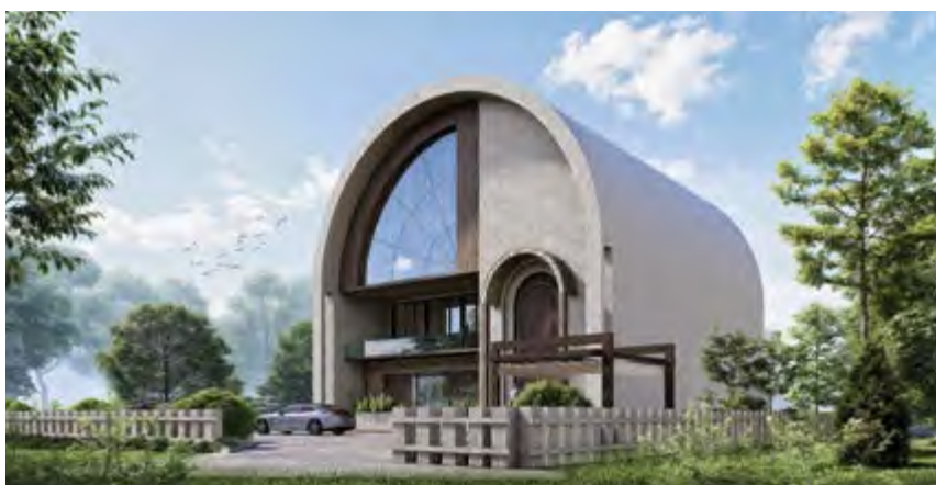
Концепт проекта бутик-отеля в городе Кяльбяджар

мические факторы. На рынок выходят компании или отдельные специалисты с недостаточным опытом, которые предлагают услуги по заниженным ценам. Например, если наша компания оценивает проект на определенную сумму, на рынке могут появиться группы, готовые выполнить ту же работу за значительно меньшие деньги. Такой подход привлекает заказчиков экономией средств, однако в итоге приводит к снижению качества работ. Это негативно сказывается на всей отрасли, так как заниженная стоимость труда профессионалов обесценивает услуги всех проектных компаний, а также