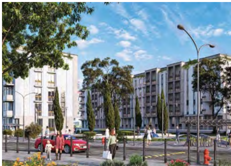
Концептуальное решение для жилых домов квартирного типа, предназначенное для студентов