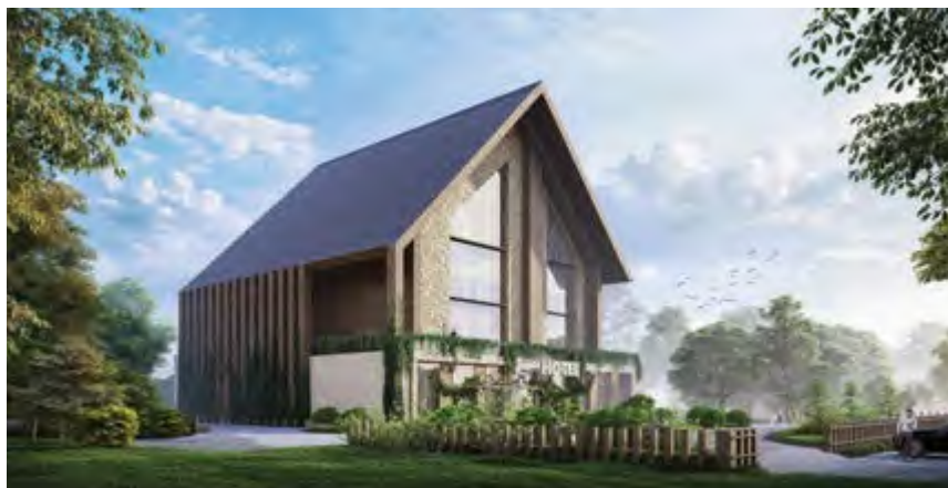
Концепт проекта бутик-отеля в городе Кяльбяджар

устойчивость, гармоничное сочетание зданий с природным ландшафтом, создание комфортных и функциональных пространств для жизни и работы, а также внедрение интеллектуальных технологий в управление зданиями. Наша компания стремится следовать этим трендам, разрабатывая инновационные, практичные и традиционно уважаемые проекты.