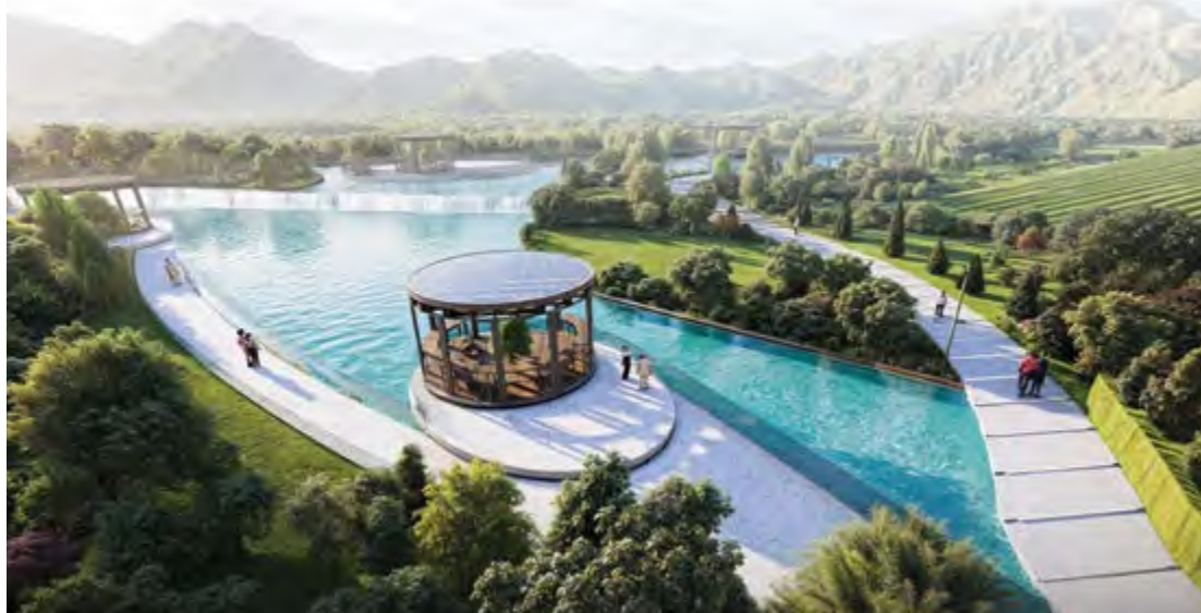
Город Кяльбаджар. Концепт парка, который будет спроектирован на улице 20 января

– У нас нет жестко зафиксированной философии, но мы стараемся создавать проекты, максимально соответствующие пожеланиям заказчика и потребностям людей. Наша цель – предлагать интересные и эстетически привлекательные архитектурные решения для городов и районов. В Азербайджане начинается новый этап в развитии архитектуры, и мы, как компания, стремимся оставить в ней свой неизгладимый след. И, к счастью, нам это удастся.