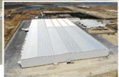
“Veysəloğlu” Logistika Mərkəzi Mehəmmədi kəndi

Sənaye və kommertiya təyinatlı tam komplektli hermetik polad binalar «Astron»