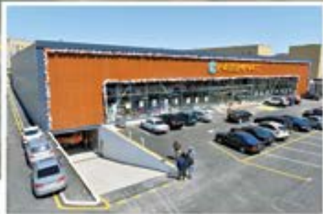
“Kingsmart” supermarket Lökbatan

Tam komplektli hermetik polad binaların layihələndirilməsi, istehsalı, çatdırılması, quraşdırılması və servisi