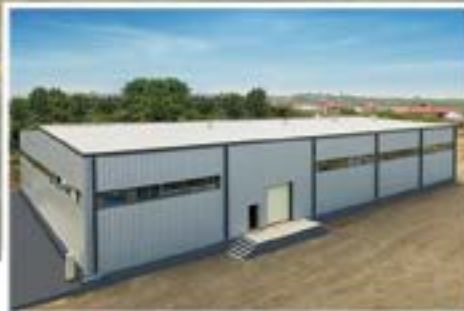
“ECO DRY” Quru Meyvə istehsalı Fabriki Quba şəhəri