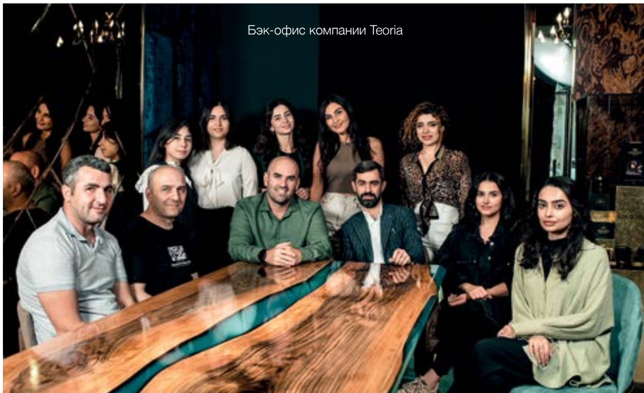
Бэк-офис компании Teoria